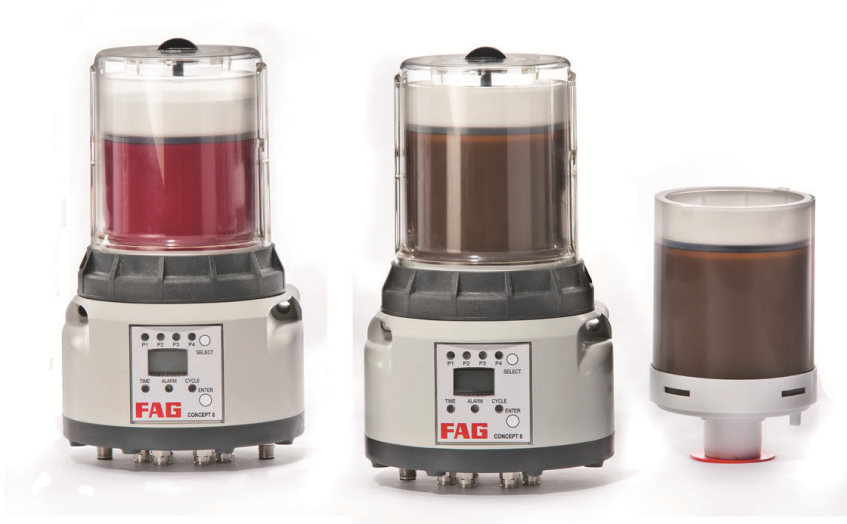
匣式 FAG 概念 8